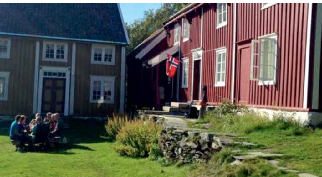
Lavollen aktivitetssenter i Trondheim er et avlastnings- og aktivitetstilbud for unge personer med demenssykdom. Stedet tilbyr en rekke aktiviteter og har tilbud både for brukere og pårørende.