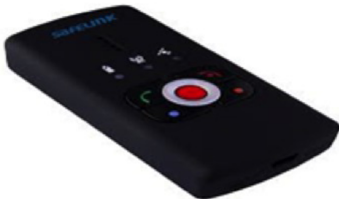
Figur 1 Springseining

Springseininga (her forkorta til SE) som vart vald for dette prosjektet er ein Tracker SL-5, frå den danske leverandøren Safecall, sjå figur 1. Sintef og Trygge-spor prosjektet gjorde ei omfattande produktkartlegging der denne trackeren var den som vart vurdert som sikrast og best utprøvd (Ausen m.fl., 2013).